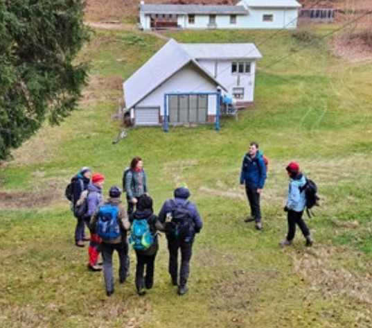
Die Skibaude am Skilift

Es liegt in der Natur der Sache. Menschen, die sich im entlegenen Outdoorbereich bewegen und hier ihre Abenteuer suchen, setzen sich unterschiedlichsten Gefahren aus. Wer viel unterwegs ist, ggf. auch selbst Gruppen führt, kommt daher mit hoher Wahrscheinlichkeit früher oder später in die Situation, Menschen in Not helfen zu müssen. Um möglichst wirkungsvoll, selbstschützend und schnell im Falle eines Unfalles im Gebirge agieren zu können, ist Sachkunde essenziell. Aus diesem Grund hat der Vorstand unserer Sektion im November 2025 einen zweitägigen Outdoor-Erste-Hilfe-Kurs organisiert. In diesem konnten Mitglieder unseres Vereins, die in der Tourenführung sowie in der Betreuung und Ausbildung von Kinder- und Jugendgruppen engagiert sind, ihre Kompetenzen erweitern.