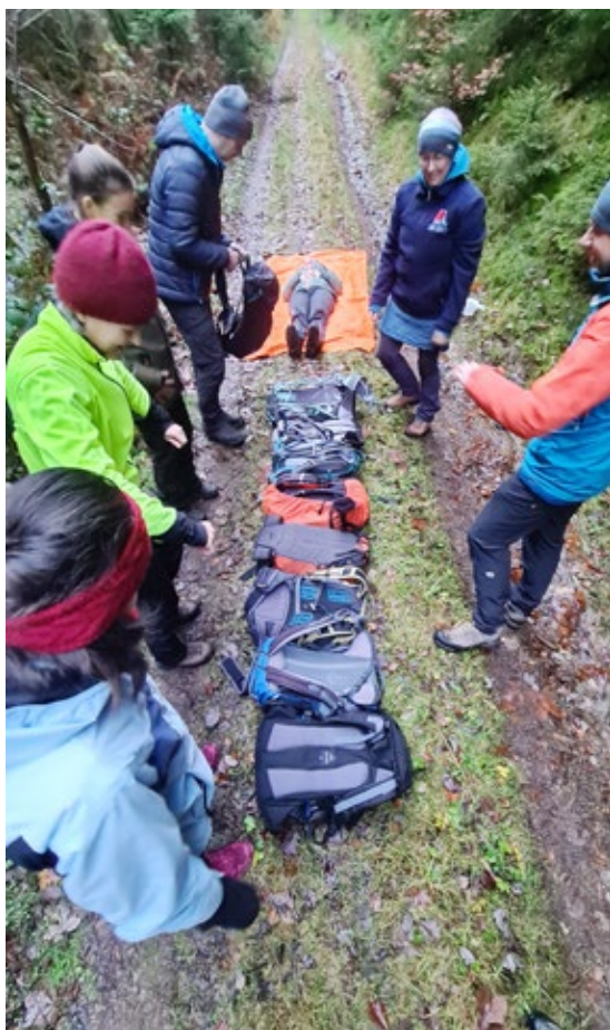
Patientenlagerung auf einem Rucksackbett

Der zweitägige Kurs bot uns einen spannenden Wechsel zwischen theoretischer Wissensvermittlung und praktischen Übungen. Die jeweils ausführliche Nachbesprechung der unterschiedlichen Übungssituationen im Gelände vertieften das Wissen, eröffneten die Möglichkeit, die eigene mit den Sichtweisen anderer zu vergleichen und machten das Lernen aus Fehlern zu einem prägenden Erlebnis.